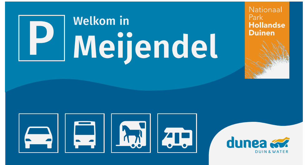
ABC-borden (regels, toegang, etc.)