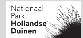
NPHD logo's voorzwart-wit communicatiemiddelen