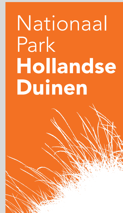
NPHD - verticaal