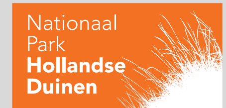
NPHD - horizontaal